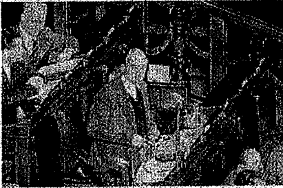
Almirante durante una seduta del parlamento

Nel marzo 1948 , in vista delle elezioni politiche Almirante tenne diversi comizi in giro per l'Italia ma la maggior parte di questi gli fu impedita per l'ostracismo degli interventi violenti di militanti comunisti. [15] Solo nel sud la situazione risultò più tranquilla. Il clima politico portò anche ad altri candidati del MSI l'impedimento a effettuare comizi in pubblico. [16] Ciononostante, Almirante riuscì eletto in Parlamento fin dalla prima legislatura ( 1948 ) e fu sempre rieletto alla Camera dei deputati . Il 10 ottobre 1948 nel corso di un nuovo comizio, nuovamente in piazza Colonna , si accesero violenti scontri questa volta con le forze dell'ordine.