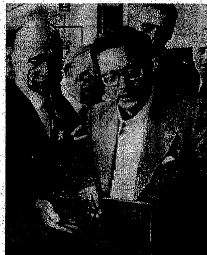
Almirante con Pino Rauti, nel 1969, in occasione del rientro di quest'ultimo nel MSI.

Dopo la morte del segretario Arturo Michelini si aprì il dibattito su chi dovesse succedergli. Si fece l'ipotesi di Giovanni Roberti , leader della Cisnal , ma prevalsero i sostenitori di Almirante che tornò il 29 giugno 1969 al vertice del partito. A far prevalere la candidatura di Almirante concorse il fatto che, pur essendo malvisto all'interno della nuova corrente maggioritaria e moderata di Michelini, egli non aveva mai rinunciato a essere il punto di riferimento della base più movimentista e antisistema [20] . A seguito della sua elezione alla segreteria rientrarono nel partito parte dei dissidenti del Centro Studi Ordine Nuovo guidati da Pino Rauti . Almirante, dopo gli anni di immobilismo di Michelini, operò immediatamente un riassetto organizzativo e ideologico del partito che fu definito come la " politica del doppiopetto ", e che rimase sempre in bilico tra le rivendicazioni dell'eredità fascista e l'apertura al sistema politico italiano. Almirante riassunse così la sua strategia: