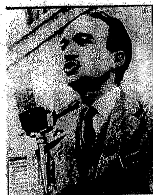
Giorgio Almirante in un comizio negli anni '50