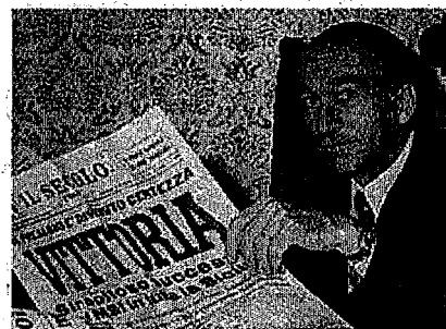
Almirante con una copia del Secolo d'Italia che celebra la vittoria del Movimento Sociale Italiano alle elezioni regionali in Sicilia del 1971

Si distinse in diverse battaglie per la difesa dell'italianità sul territorio nazionale, pronunciando discorsi-fiume (anche di nove ore) a favore del ritorno all'Italia di Trieste , la cui "questione" non era ancora stata risolta, e poi contro la modifica dello statuto speciale del Trentino-Alto Adige , con la quale veniva attuata la tutela della comunità di lingua tedesca ma che a suo vedere era troppo sbilanciata a sfavore della comunità italiana, e contro l'istituzione delle regioni nel 1970. Criticò anche la legge Scelba che vietava la ricostituzione del Partito Fascista. Agli inizi degli anni sessanta si batté contro la nazionalizzazione dell'energia elettrica.