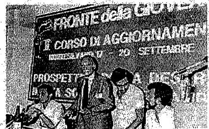
Almirante a un corso di aggiornamento del Fronte della Gioventù nel 1981, in compagnia di un giovane Gianfranco Fini alla sinistra, a destra Maurizio Gasparri seduto Almerigo Grilz

Nel 1978, in previsione delle elezioni europee del 1979, Almirante fondò l' Eurodestra . Nella seconda metà degli anni settanta, in piena emergenza terrorismo , si schierò per l'introduzione della pena di morte per i terroristi colpevoli di omicidio [48] e successivamente contro la legalizzazione dell'aborto .